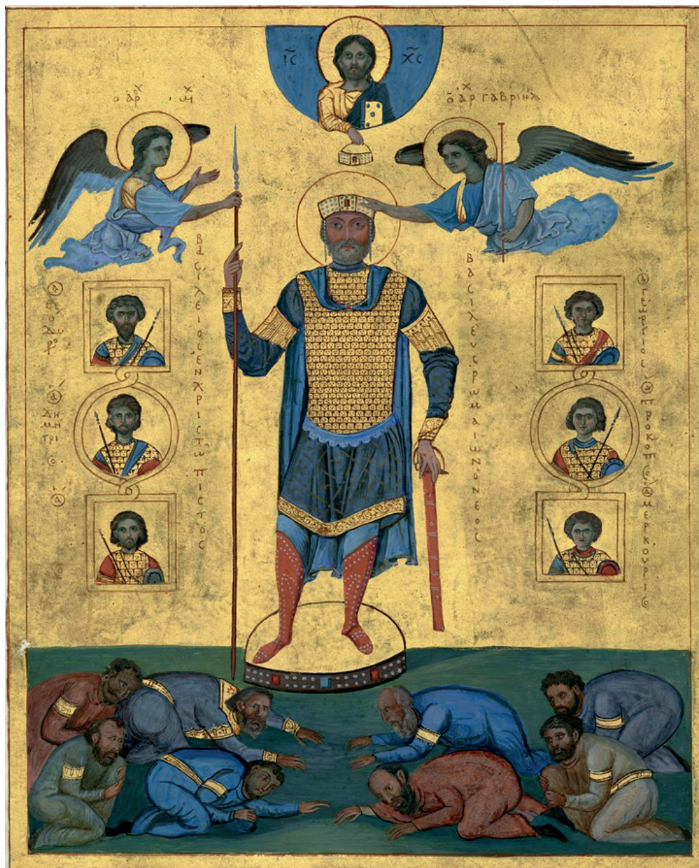
Replica di una miniatura dell'imperatore Basilio II in abiti trionfali, a esemplificazione della corona imperiale tramandata dagli angeli. Replica del Salterio di Basilio II (Salterio di Venezia), BNM, Ms. gr. 17, fol. 3r