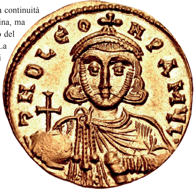
Solidus dell'Imperatore Leone III Isaurico ca 724/731

un'importante testimonianza della continuità del diritto romano nell'età bizantina, ma anche come un precursore storico del moderno diritto penale militare. La sua analisi comparativa con gli ordinamenti contemporanei non solo arricchisce la comprensione del fenomeno normativo antico, ma offre un significativo punto di osservazione per comprendere le costanti strutturali del diritto militare nelle società complesse.