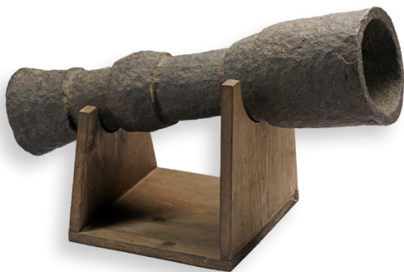
Bombardella in ferro fucinato, Italia centro-settentrionale, fine XIV secolo. Brescia, Museo delle armi "Luigi Marzoli", inv. 101.